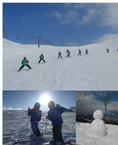
*各写真はいまままでに実施した際の写真です。

スキーが初めてでも大丈夫!! 「楽しく滑る」をモットーに、スキーを好きになることから始め ます。キャンプリーダーが指導するので、スクールのような厳し さはありません。コツをつかめばどんどん上達していきますよ♪ さあ、スキーを始めましょう!!