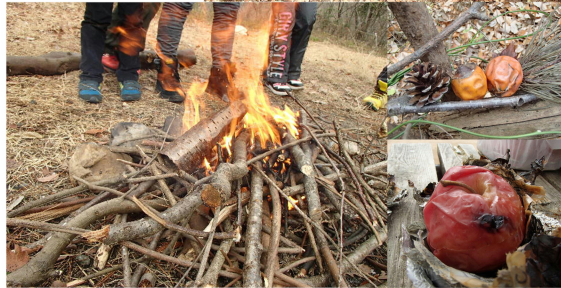
*各写真はいまままでに実施した際の写真です。

寒い冬でも元気に過ごす、心も体もぼっかぽか♪ 冬の森ってどんなかな?ひんやりひっそりと冬を越す自然 の中へ、さあ出発!森のタカラモノで、ひみつのおうちを 作ったり、たき火でおやつをつくったり。 2015年最後のキャンプは、これで決まり!